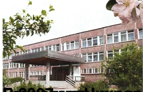
В 1999 году в школе открылся кабинет Почетного гражданина города Нижний Тагил