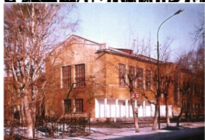
В 1975 году в школе открылся кабинет Математики и химии. В 1980 году в школе открылся кабинет