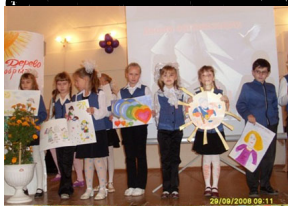
В 2002 году в школе открылся кабинет Президентской России и МБОУ СОШ № 5